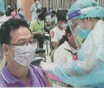
เข็ม ๑ ประชาชนใน จ.นครปฐม ไปฉีดวัคซีนป้องกันโควิด-๑๙ โดยลงทะเบียนฉีด ๒,๗๐๐ คน แต่ขอ-ขยายกรณีให้ครอบคลุมถึงผู้สูงอายุตามกลุ่ม.