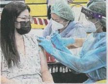
ป้องกัน ประชาชนตั้งตัวไม่ติดฉีดวัคซีนป้องกันโควิด-๑๙ ที่ศูนย์กีฬาเทศบาลรัตนบุรีที่ศูนย์. ตั้งใจใหญ่. บางรายข. น.ง.นบุรี จัดฉีดแบบขอคืน.